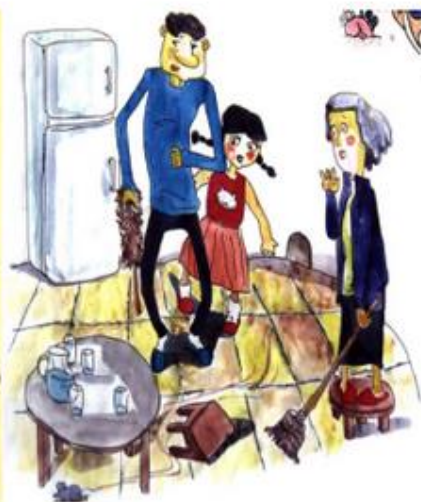
记叙文《捉老鼠》插图